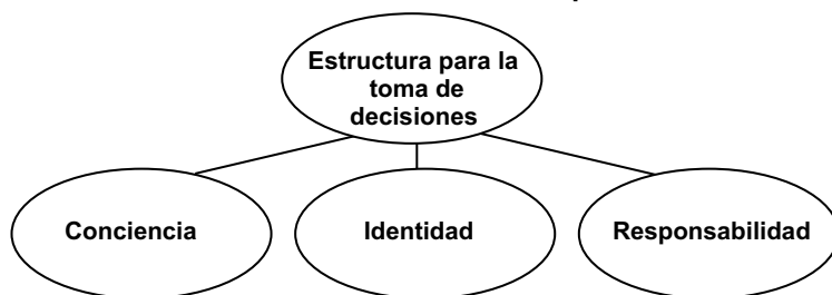
Diagrama 2 “Estructura moral” de las empresas

Haciendo el mismo ejercicio de esquematización que hacíamos respecto a la estructura moral de las personas, la “estructura moral” de las empresas luciría como se ilustra en el diagrama 2; lo que brinda unidad a la “estructura moral” de las empresas es, valga la redundancia, su estructura para la toma de decisiones. En efecto, dado que las organizaciones tienen una estructura para tomar decisiones