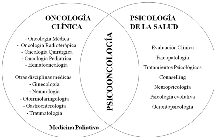
Figura. 1: La psicooncología como intersección entre la Oncología y la Psicología de la Salud

En el presente trabajo se considera la psicooncología como un campo interdisciplinar de la psicología y las ciencias biomédicas dedicado a la prevención, diagnóstico, evaluación, tratamiento, rehabilitación, cuidados paliativos y etiología del cáncer, así como a la mejora de las competencias comunicativas y de interacción de los sanitarios, además de la optimización de los recursos para promover servicios oncológicos eficaces y de calidad (ver la Fig.1).